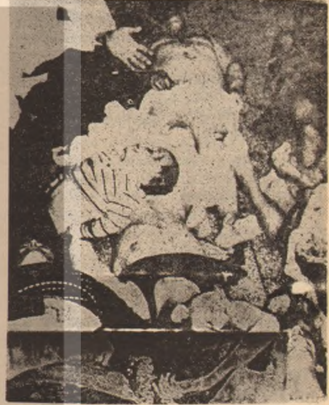
Kadın-erkek, yaşlı, genç (çocuk, hatta bebek, hatta ve hatta ana rahminde cenin) demeden katletmek.. İşte parababalarının kanlı diktatörlüğü faşizm gerçek yüzü..